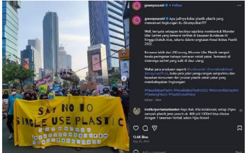
Gambar 3. Kampanye offline #PantangPlastik dan disebar di Instagram