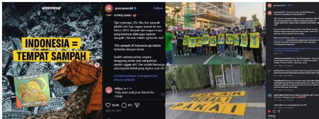
Gambar 5. Dokumentasi kampanye offline di sebarakan melalui Instagram

Advokasi Kampanye digital #PantangPlastik menunjukkan bagaimana Greenpeace Indonesia memanfaatkan Instagram untuk memberi audiens pengalaman visual, kontekstual, dan emosional serta relevan. Hal ini juga selaras dengan Teknologi Imersif dalam konsep Environmental Advocacy Communication. Narasumber juga mengatakan “Kita manfaatin fitur digital di Instagram supaya orang benar benar merasa terlibat. Pake reels, Story IG, Carousel, kadang disampaikan serius, kadang pakai komedi atau mengikuti trend yang lagi ramai. Kita pakai meme juga supaya narasi seperti guna ulang itu lebih mudah diterima. Kita juga mengedepankan partisipasi, misalnya lewat brand audit. Kita perlihatkan bagaimana dunia NGO itu bekerja, gerakannya seperti apa, supaya orang merasa bisa ambil peran. Jadi bukan cuma lihat konten, tapi merasa jadi bagian dari gerakan, akhirnya bergabung di greenpeace sebagai volunteer. Misalnya, kita angkat isu mikroplastik, kita nggak cuma kasih data aja, tapi mengemas bagaimana partikel plastik itu bisa masuk ke tubuh lewat makanan, minuman, bahkan dari air hujan. Jadi orang bisa membayangkan sendiri dampaknya”