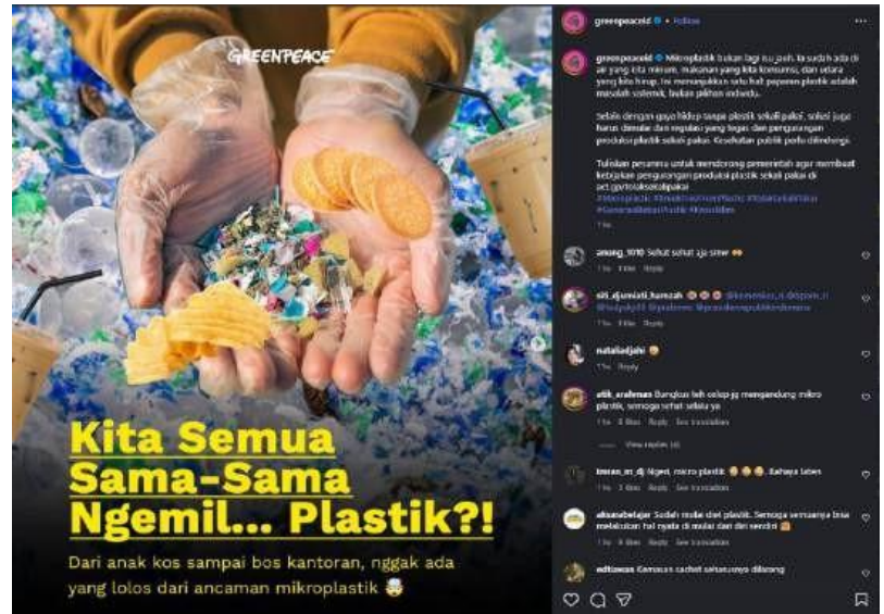
Gambar 4. Kampanye digital #PantangPlastik di Instagram @greenpeace.id

Strategi advokasi kampanye Greenpeace Indonesia tidak hanya bersifat konfrontatif, tetapi juga menggunakan pendekatan storytelling sebagai solusi. Narasi dengan metode storytelling juga diterapkan oleh Greenpeace Indonesia, hal ini juga menjadi elemen penting dari konsep Environmental Advocacy Communication, bagian Naratif Storytelling. Seperti hasil dari wawancara, narasumber mengatakan “Strategi membangun narasi kita tuh sebenarnya mencoba untuk mengangkat isu lingkungan supaya lebih dekat dengan kehidupan sehari-hari gitu. Kalau ngomongin plastik nih, salah satu contohnya kita naikin narasi mikroplastik sebagai dampak dari masalah sampah plastik. Kita dekatkan ke hal yang lebih relate, misalnya kesehatan. Jadi kita jelasin tuh bahwa plastik yang hancur itu bisa jadi partikel kecil dan masuk ke tubuh lewat makanan, minuman. Temuan riset hujan di Jakarta ada mikroplastiknya. Jadi berdampak langsung ke tubuh mereka gitu. Sehingga urgensinya lebih terasa, Nah dengan pendekatan kayak gini kan jadi lebih personal ya dampaknya. Terus kita juga melebarkan narasi ke luar lingkup aktivis lingkungan dengan menggandeng komunitas yang bukan lingkungan gitu, seperti yang fokusnya di ekonomi, kesehatan, bisnis, UMKM, startup, influencer yang bukan dari bubble yang sama, kampus juga kita gandeng. Jadi supaya isu plastik ini nggak